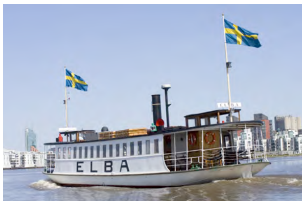
M/F Elba, gebaut 1897, 262 Passagiere, täglicher Sommerverkehr