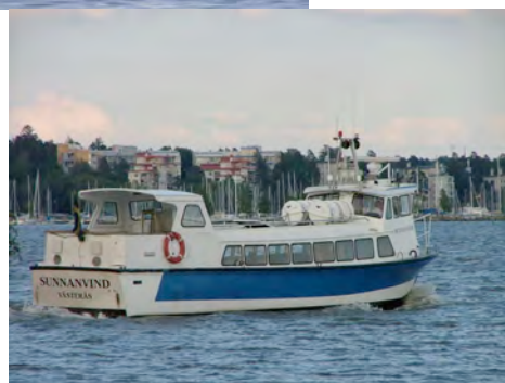
M/S Sunnavind, 48 Passagiere, Täglicher Verkehr im Frühjahr, Sommer und Herbst