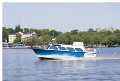
Das Taxiboot Diana, 12 Passagiere