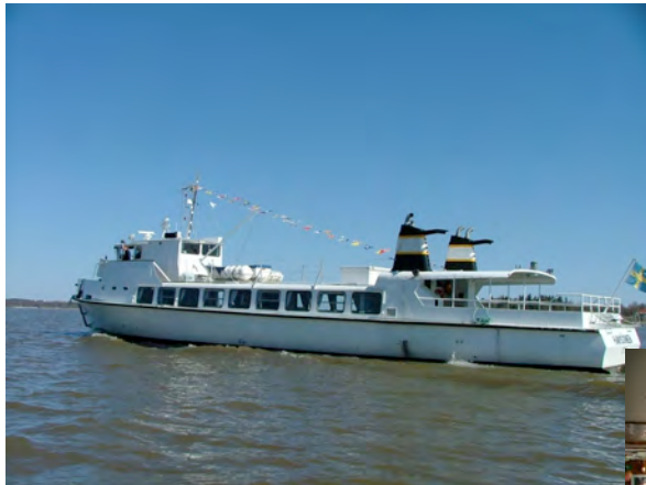
M/S Havsörnen ("Águila Marina"), 200 pasajeros, cafetería a bordo, tráfico diario durante el verano