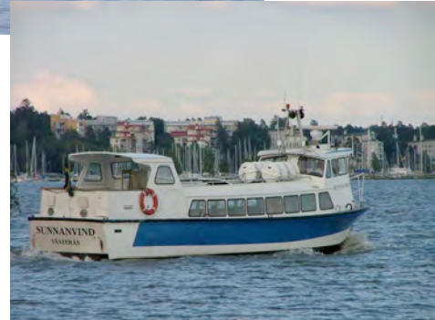
M/S Sunnanvind ("Viento del Sur"), 48 pasajeros, tráfico diario durante la primavera, el verano y el otoño