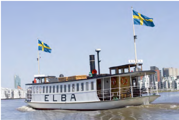
M/F Elba, construido en 1897, 262 pasajeros, tráfico diario durante el verano