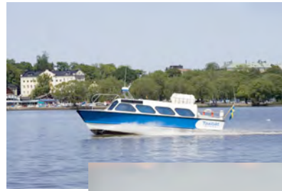
El barco taxi Diana, 12 pasajeros